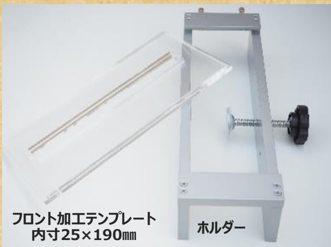
フロント加工テンプレート 内寸25×190mm